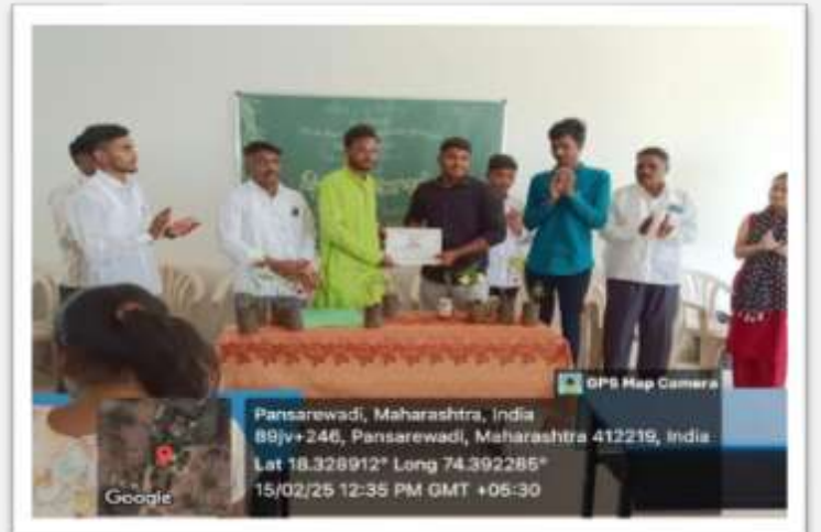
Pansarewadi, Maharashtra, India 88jv+246, Pansarewadi, Maharashtra 412219, India Lat 18.328912° Long 74.392285° 15/02/25 12:35 PM GMT +05:30