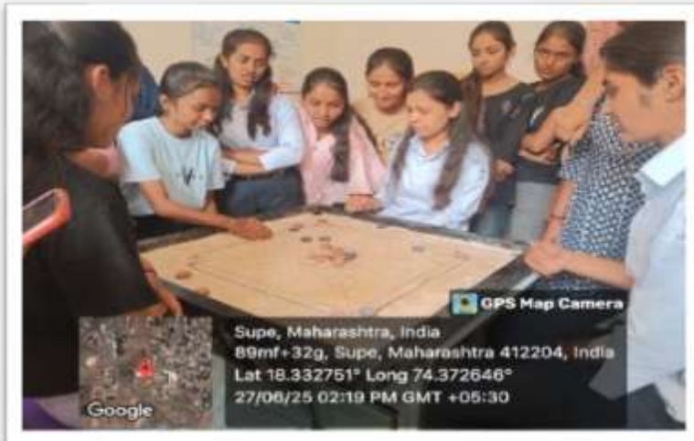
Supe, Maharashtra, India 89mf+32g, Supe, Maharashtra 412204, India Lat 18.332751° Long 74.372646° 27/08/25 02:19 PM GMT +05:30