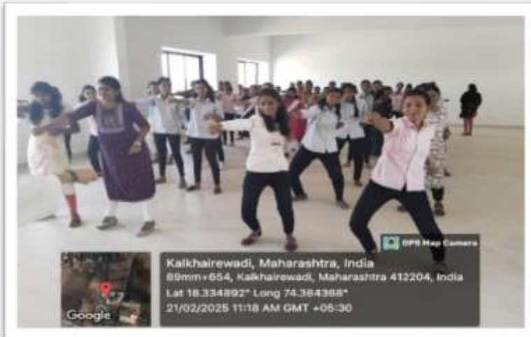
Kalkhaireswadi, Maharashtra, India 89mm+854, Kalkhaireswadi, Maharashtra 412204, India Lat 18.334892° Long 74.384368° 21/02/2025 11:18 AM GMT +05:30