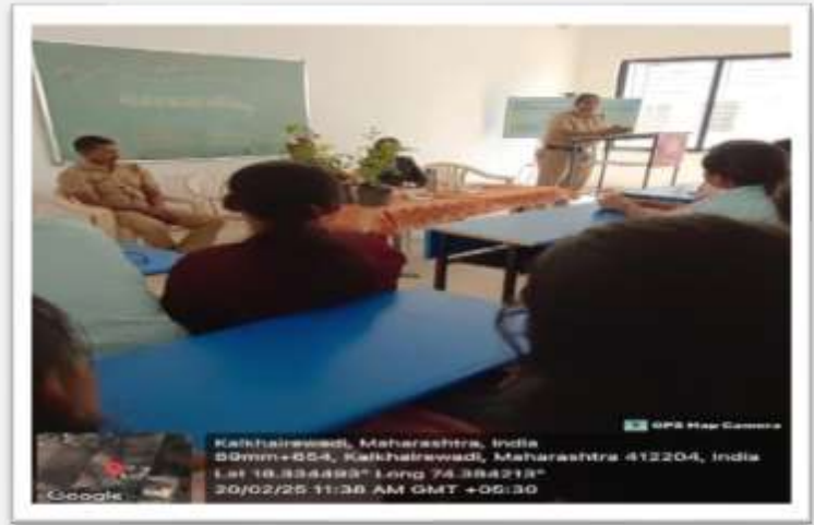
Kalkhaireswadi, Maharashtra, India 89mm+854, Kalkhaireswadi, Maharashtra 412204, India Lat 18.334893° Long 74.384213° 20/02/25 11:38 AM GMT +05:30