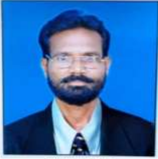
प्रा.राजपूत सुनील विद्या प्रतिष्ठान सुपे महाविद्यालय

विद्येचा जावप प्रतिनिधी : पुणे - मराठी भाषा ही केवळ महाराष्ट्रापुरती सीमित न राहता संपूर्ण देशात आणि परदेशातही अनेक मराठी भाषिक नागरिकांनी तिला जपले आहे. तिच्या सवर्षनासाठी आणि प्रसारसाठी योगदान देणाऱ्या साहित्यिक, कलावंत, आणि अभ्यासकांना एकत्र आणण्यासाठी पुण्यात विश्व मराठी संमेलन २०२५ चे आयोजन करण्यात आले. मराठी भाषेला अभिजात भाषेचा दर्जा मिळवण्याचे प्रयत्न पुण्यात हे संमेलन चालवण्यात आले. ३१ जानेवारी ते २ फेब्रुवारी २०२५ या कालावधीत घनघुंसन महाविद्यालयात हा धबधब रोहड्या पर पडला. "अभिजात मराठी" ही वंद्याच्या संमेलनाची मध्यवर्ती संकल्पना होती. त्यानुसार मराठी भाषा आणि संस्कृतीच्या जतनासाठी