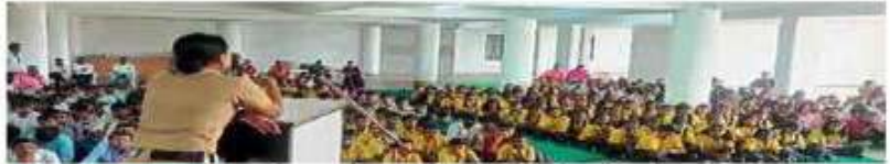
सुपे (ता. बारामती) : विद्यार्थ्यांना सुरक्षिततेविषयी मार्गदर्शन करताना.

विद्या प्रतिष्ठानच्या सुपे इंग्लिश मॉडियम स्कूल व सुपे बरिष्ठ महाविद्यालयाच्यावतीने 'सजग राहा, निर्भय राहा' या मार्गदर्शनपर कार्यक्रमाचे आयोजन केले होते. यावेळी