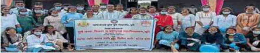
उंडवडी सुपे (ता. बारामती) : पालखीतळ स्वच्छ केलेल्या विद्यार्थ्यांसह मान्यवर.